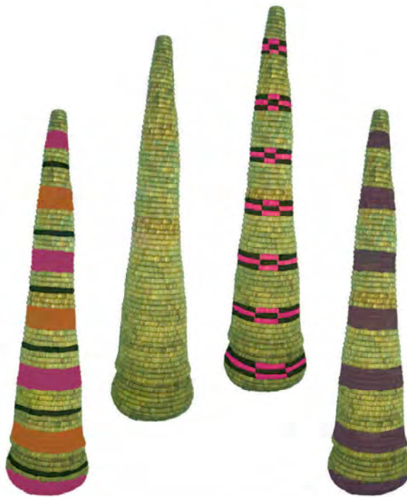
Corbeille à pain Tbeq , jonc, 2008, Khadija Kabbaj.