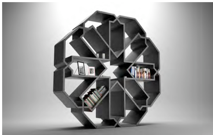
Younes Duret, étagère Zelli , 2009.

Exposition collective de DESIGN du 16 janvier au 27 février 2010 à la médiathèque de Nègrepelisse