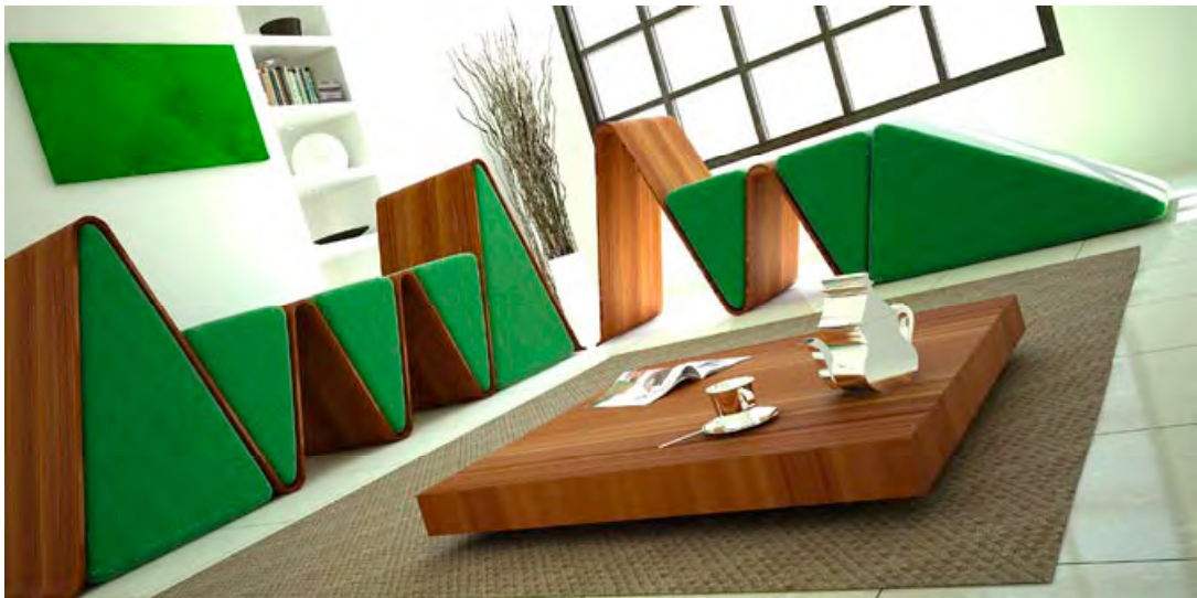
Chaise Atlas , lamelé collé, 2006, Younes Duret.

Qualifié d' esthétique industrielle , le design oeuvre pour l'harmonisation entre les formes produites et leur fonction. Il joue un rôle dans la redéfinition d'une esthétique du quotidien. La recherche d'esthétisation dans le design permet d'influer sur le choix des consommateurs en rendant le produit plus attractif. Elle n'est pas uniquement conduite par le marketing . Certains designers sont porteurs d'intentions artistiques et s'inscrivent dans le champ de l'art contemporain.