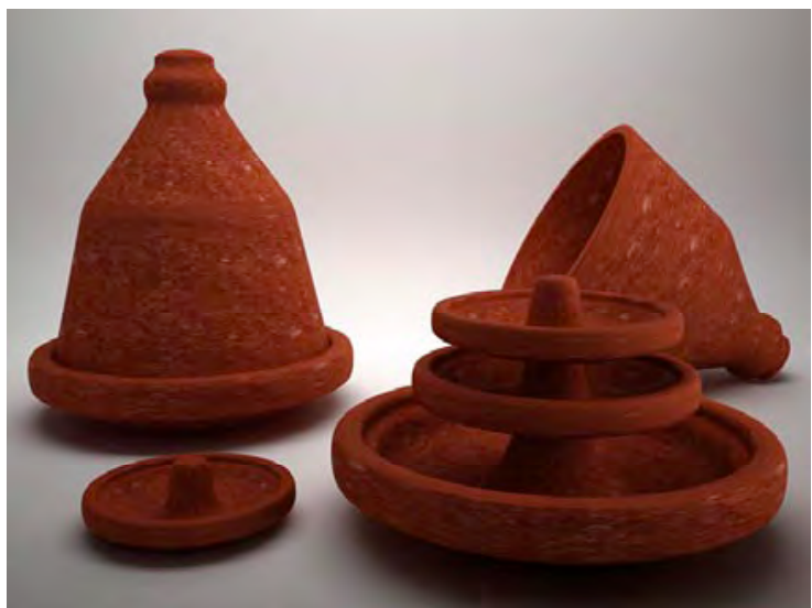
Plats Tajine , poterie, image 3D, 2009, Younes Duret.

Notre environnement est principalement composé d'objets. Qu'ils soient fonctionnels ou décoratifs, ils révèlent nos goûts, nos besoins et nos habitudes. L'identité culturelle d'un pays est profondément liée aux objets. Les créations exposées dans l'exposition Design Maghreb #2 , de par leurs formes, matériaux, titres et usages évoquent la culture maghrébine et en sont des référents identitaires.