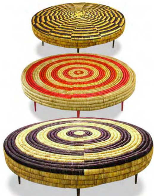
Table Tbeq , jonc et bois, 2006/2008, Khadija Kabbaj.

L'histoire du design est liée à la révolution industrielle du XIXème siècle avec l'apparition de nouveaux objets produits en série dans les usines. L'évolution du design est indissociable de celle des technologies , des matériaux et des changements de modes de vie. Les matériaux utilisés pour la création d'objets concourent à l' ergonomie d'un produit. Ils induisent une qualité ainsi qu'un procédé technique de fabrication spécifique. Les méthodes industrielles de fabrication se sont inspirées des gestes et des idées des métiers d'art et de l' artisanat .