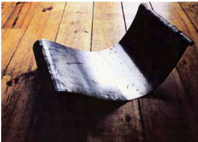
Chaise S, tôle en acier cintré, 2008, Mémia Taktak.

Le travail du jonc des tables créées par Khadija Kabbaj, de la tôle en acier cintrée de Mémia Taktak ou encore de la terre cuite des plats à tagines de Younes Duret fait référence à des matériaux populaires couramment utilisés. Les objets sont réalisés selon des techniques de fabrication traditionnelles.