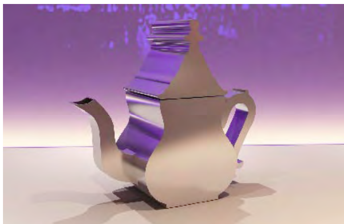
Théière Bildis , inox, 2007, Younes Duret.

Cette activité d'expression vise à un éveil artistique et culturel.