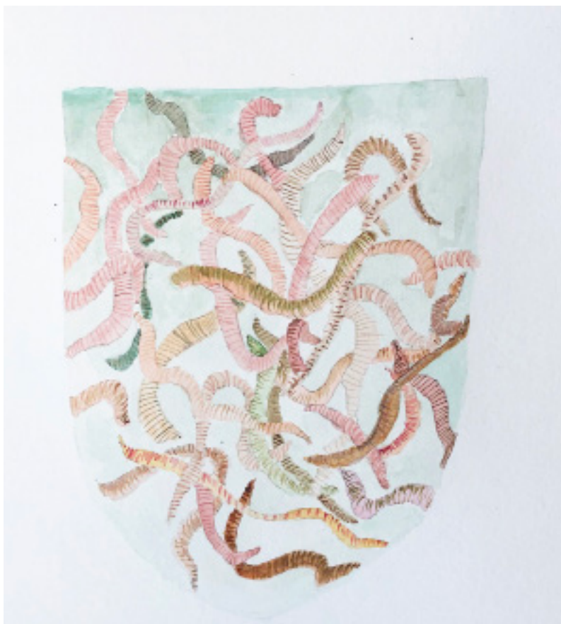
Proposition de blason pour la ville. Le Nouveau Ministère de l'Agriculture pour le Cercle de la régénération, dessin préparatoire, 2020

Un repas de produits locaux sera partagé.