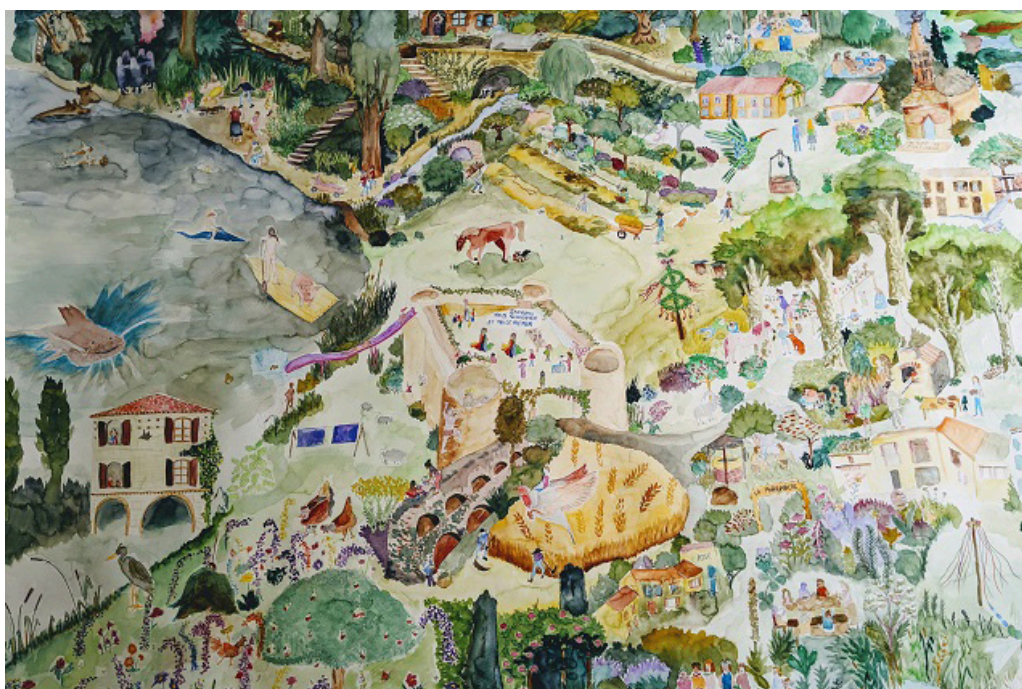
Aux arbres ! Ecotopie du Nouveau Ministère de l'Agriculture pour une stimulation des processus vitaux post nécronomie, préalable à la plantation d'une forêt nourricière à Nègrepelisse ( 2020) Aquarelle, 300 x 150 cm. (détail)

Crédits : Le nouveau ministère de l'agriculture / Logo du nouveau ministère de l'agriculture.